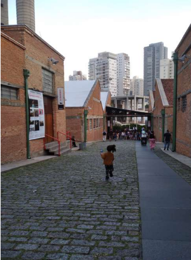
Figura 1 – Rua paralelepípedo separando os dois antigos galpões. Autoria de Yara Reis, abril de 2025.