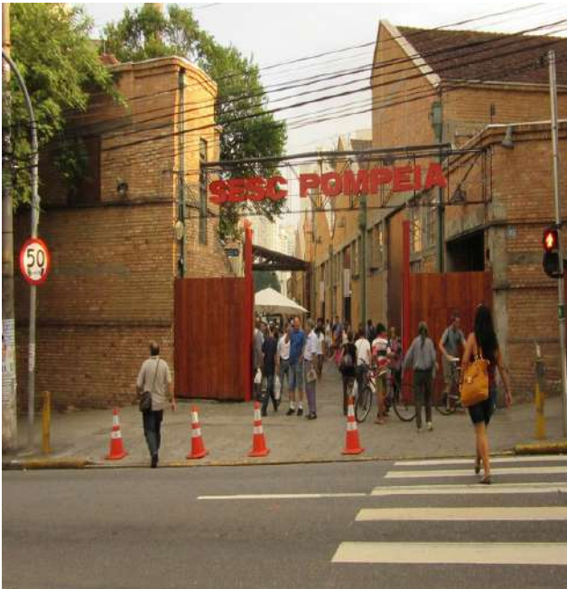
Figura 3 – Estrada do Sesc Pompeia, na Zona Oeste de São Paulo. Autoria de Paulo Toledo Piza, G1. https://gl.globo.com/sp/sao-paulo/noticia/2021/11/25/unidades-do-sesc-ampliam-atividades-para-publico-geral-a-partir-de-1-de-dezembro-em-sao-paulo.ghtml