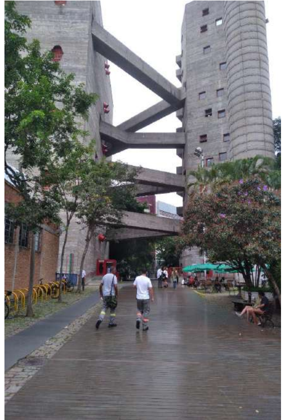
Figura 2 – Blocos de concreto da área esportiva.