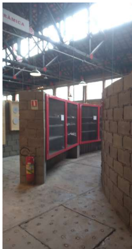
Figura 6 – Oficina de cerâmica, sem a porta de entrada. Autoria de Yara Reis, abril de 2025.